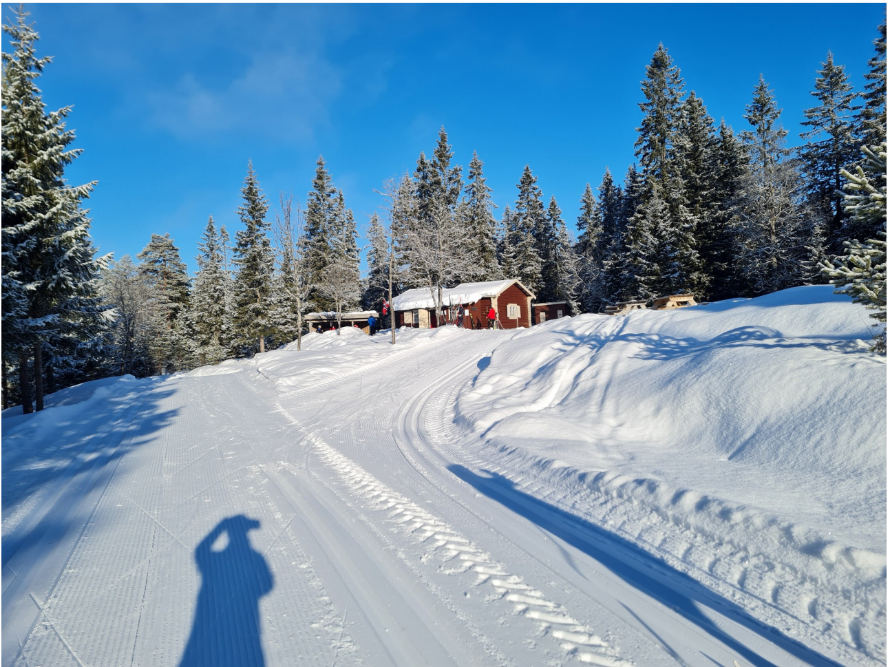
Noen gikk helt til Vingerdalshytta. 8,5km + retur.