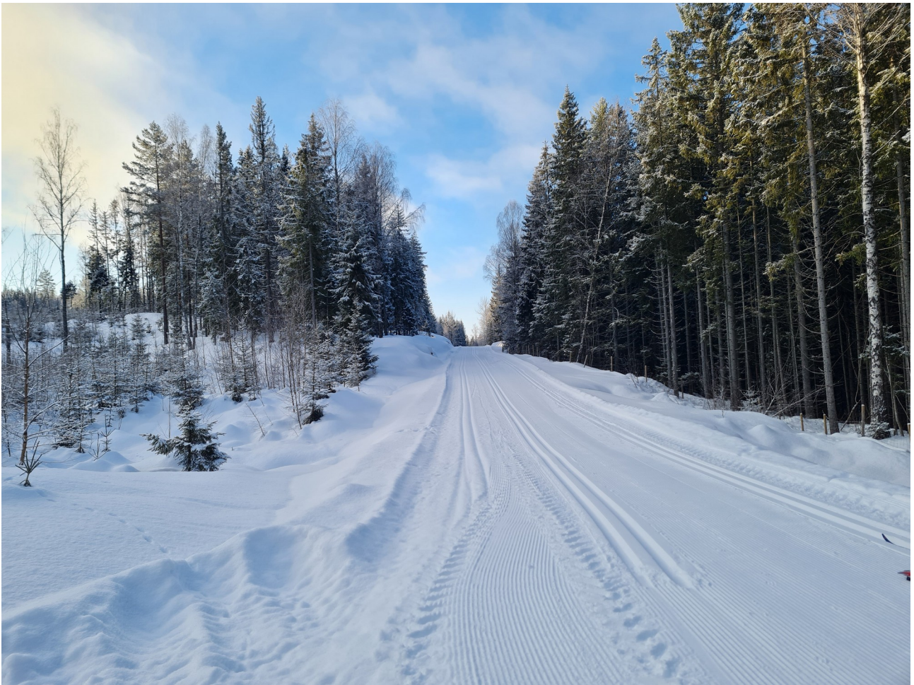
Utrolig flotte, nyoppkjørte løyper mot Kinna på søndag.