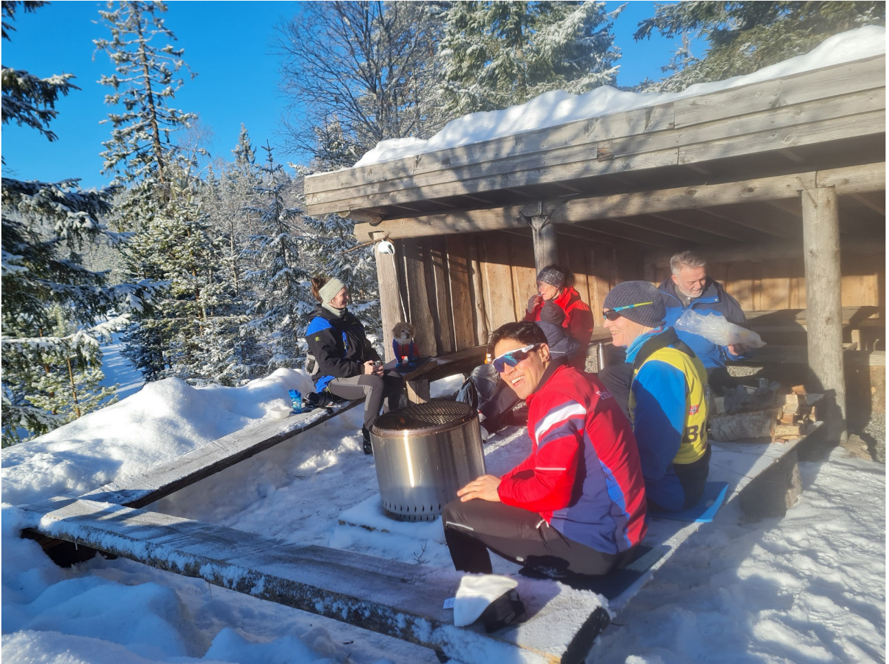
Bålpanne å varme seg rundt. Inne i hytta kunne man få kjøpt vafler og varmt drikke.